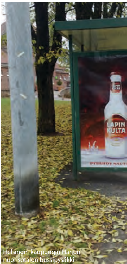
Helsingin kaupungin Harjun nuorisotalon bussipysäkki